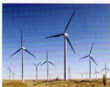
金风科技风电螺栓