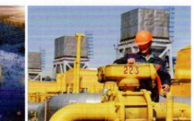
俄罗斯阿穆尔气体处理项目