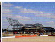
英国奥林匹克体育馆